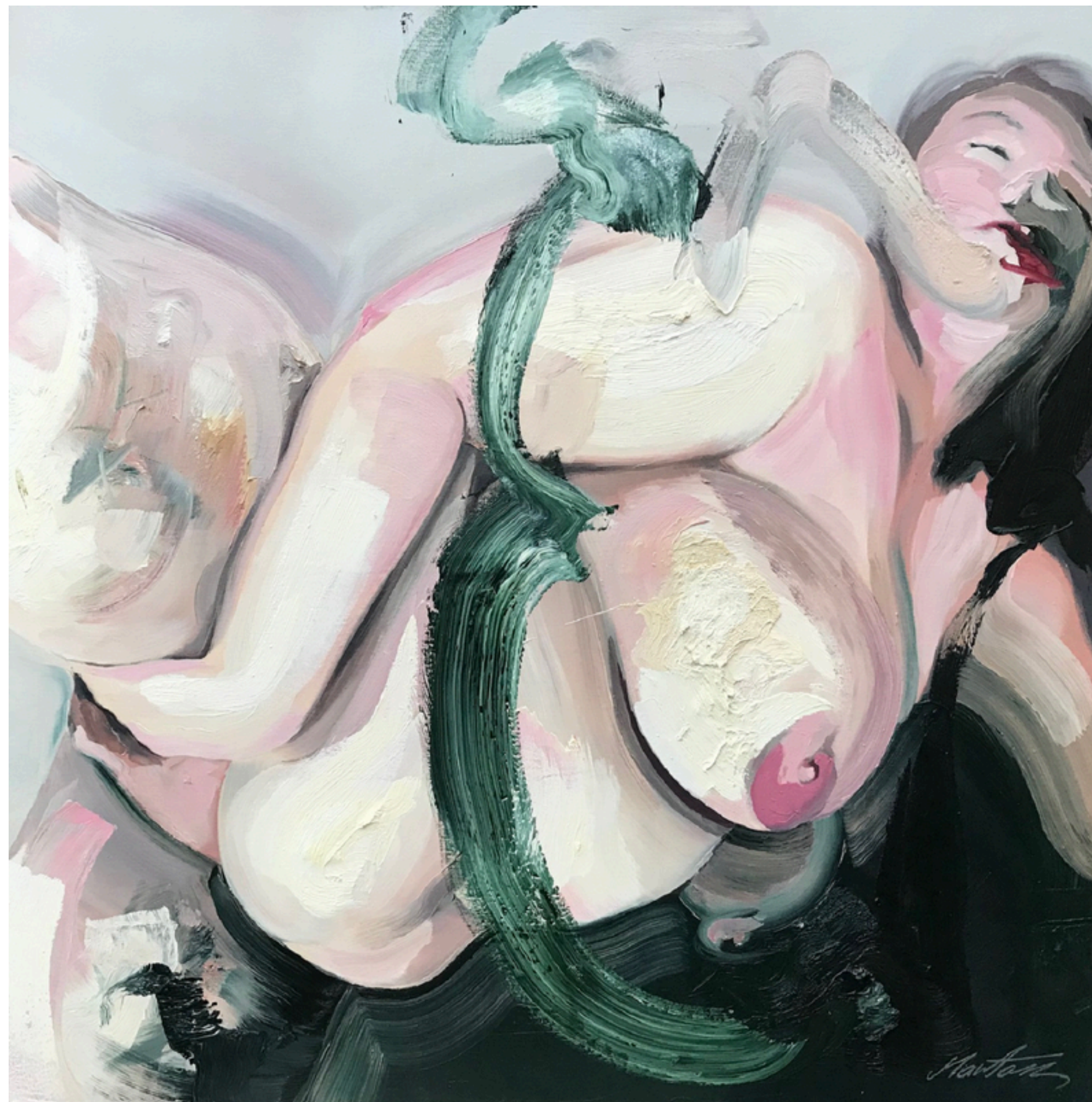
Ciało hedonistyczne 4, olej na płótnie, 100x100, 2021