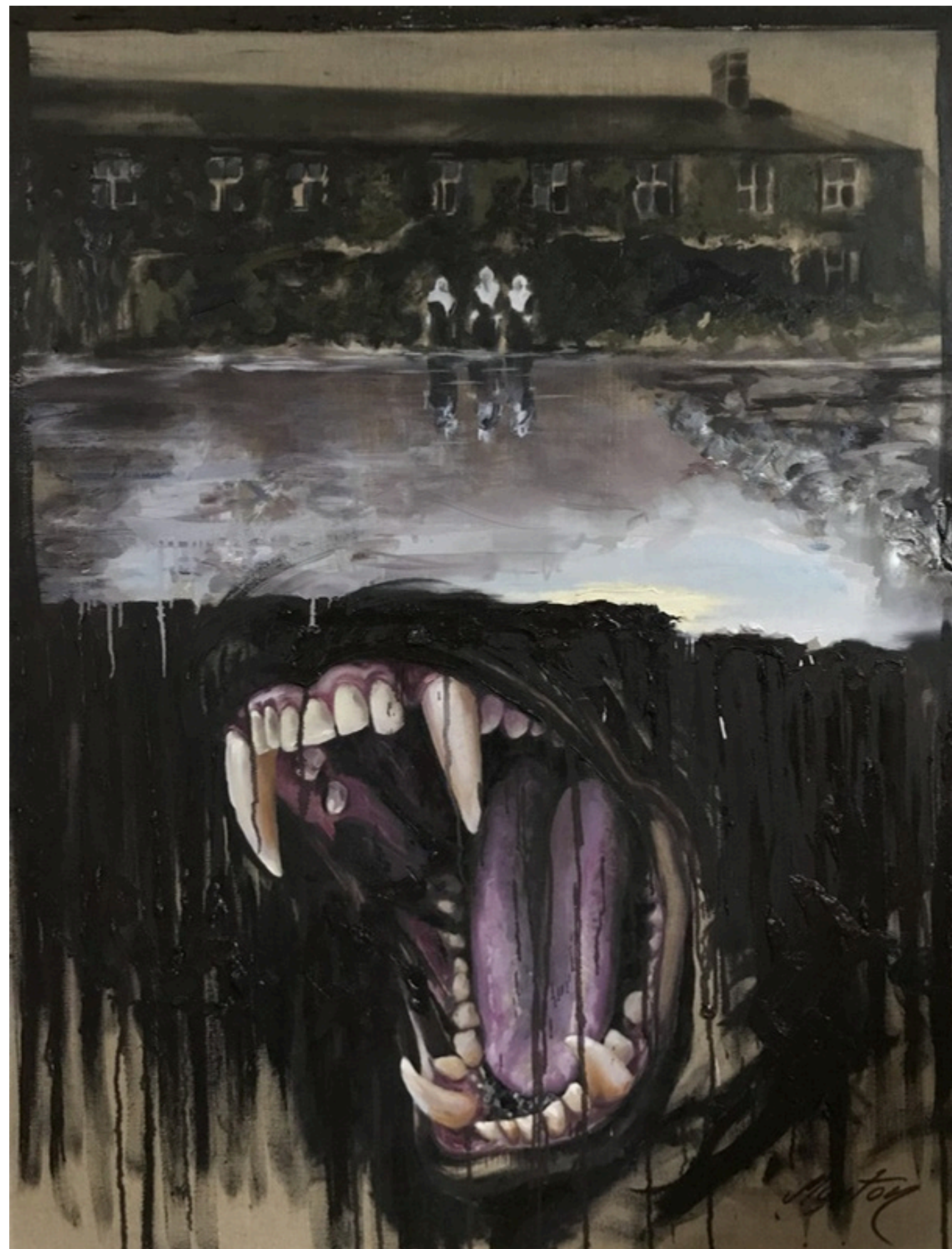
Tożsamość miejsc: Gra w zbawienie TUAM, olej na transparentnym, jutowych płótnie, 130 x 100, 2025