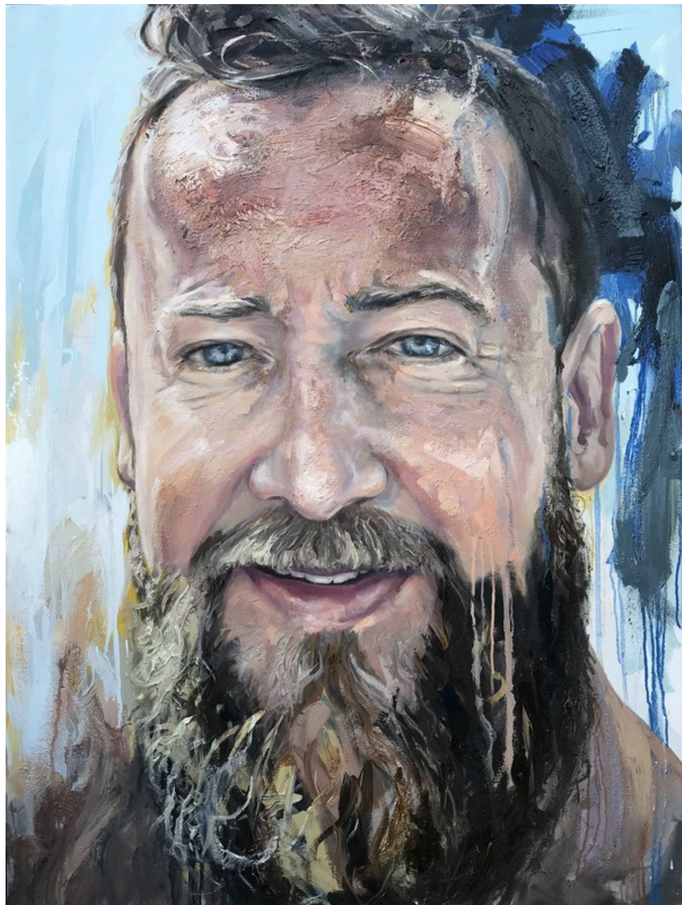
Joshua, olej na płótnie, 122 x 91, 2024