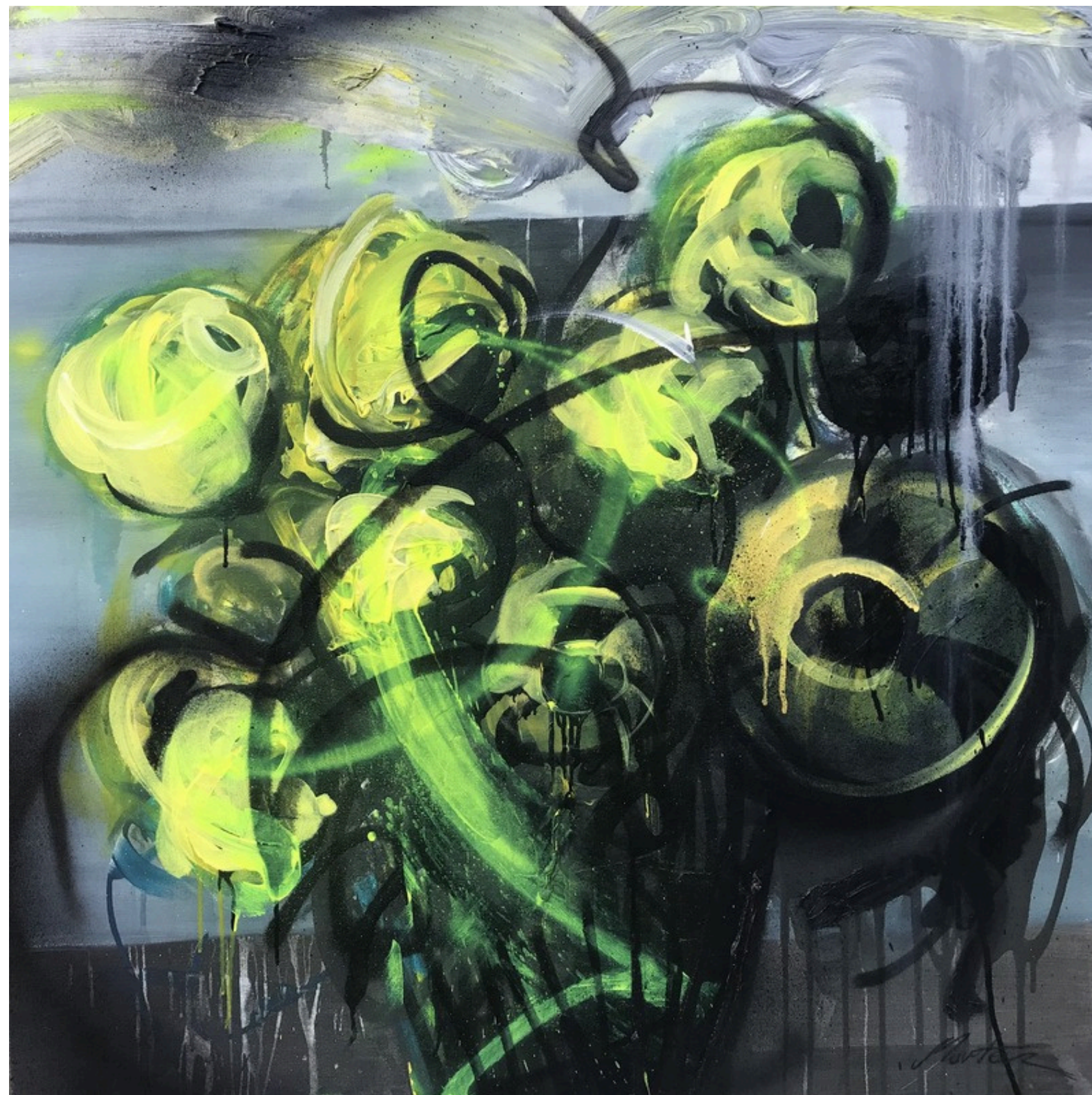
Radioaktywne słoneczniki 2, technika mieszana na płótnie, 100x100, 2023