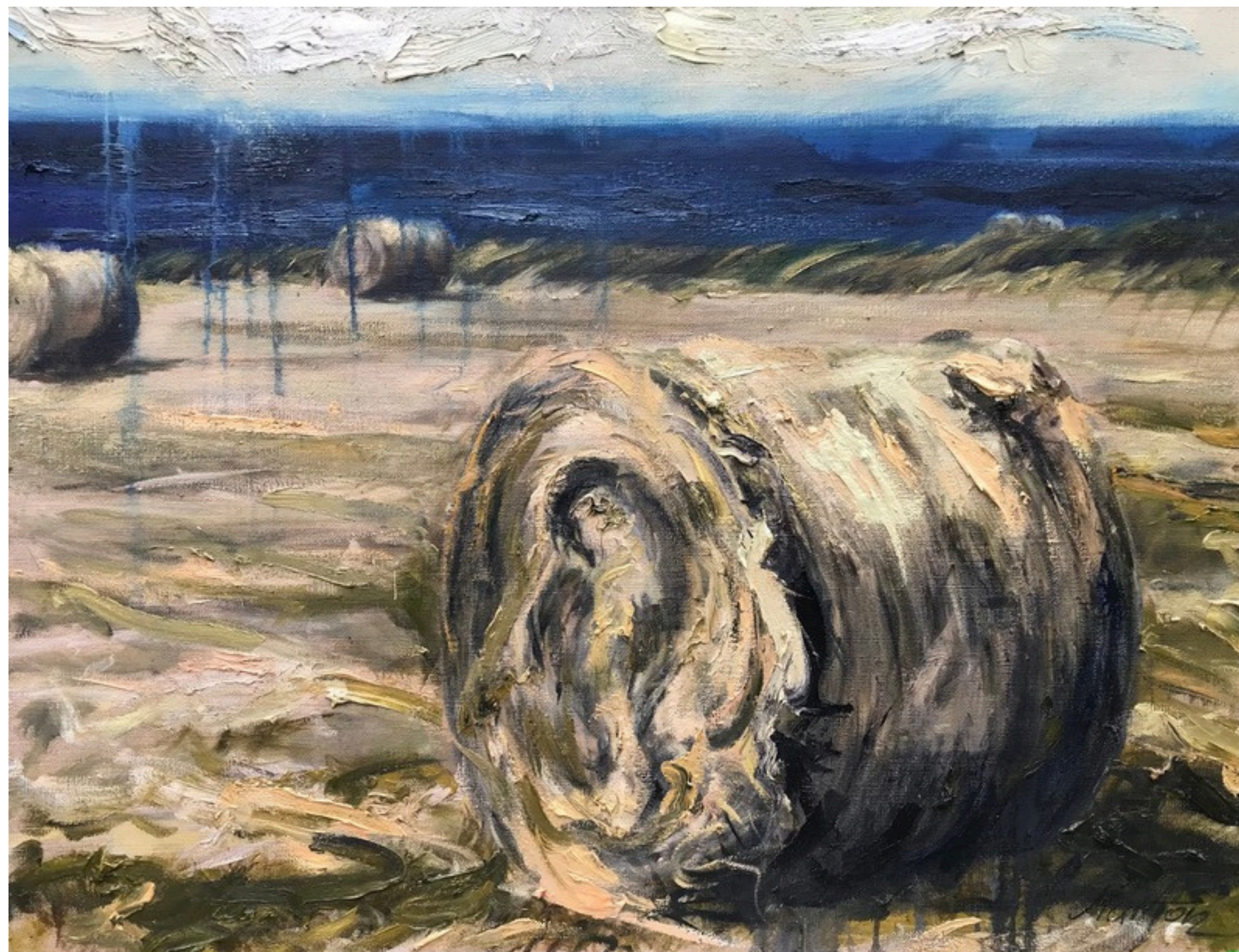
Żniwa nad Oceanem Atlantyckim, olej na transparentnym, jutowych płótnie, 130 x 100, 2025