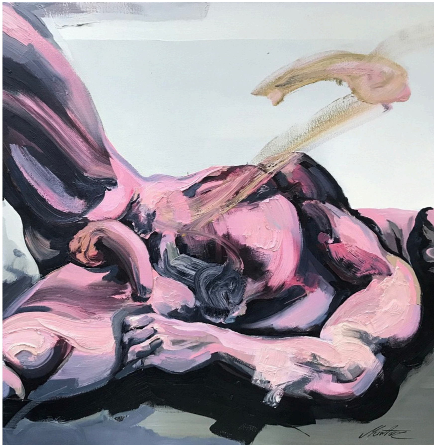
Ciało hedonistyczne 5, olej na płótnie, 100x100, 2021