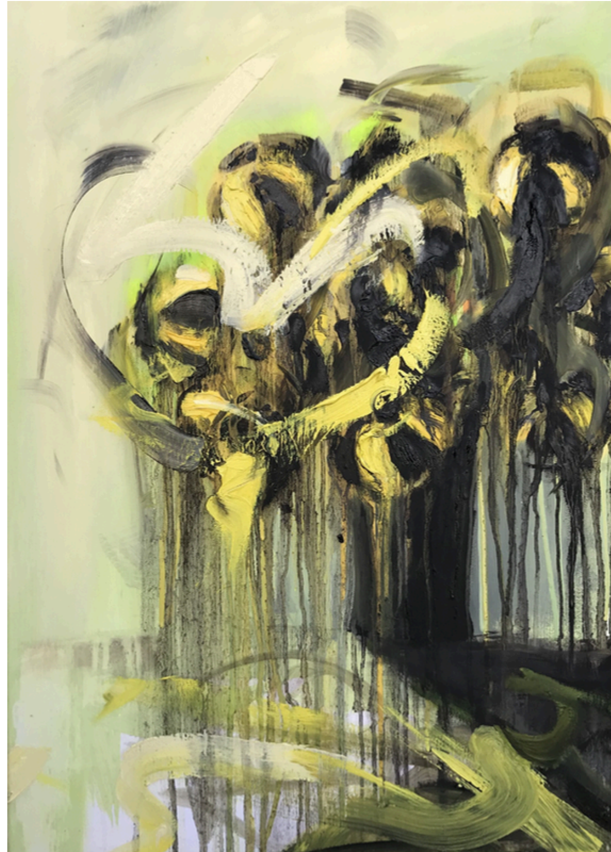
Radioaktywne kwiaty, technika mieszana na płótnie, 100x100, 2023