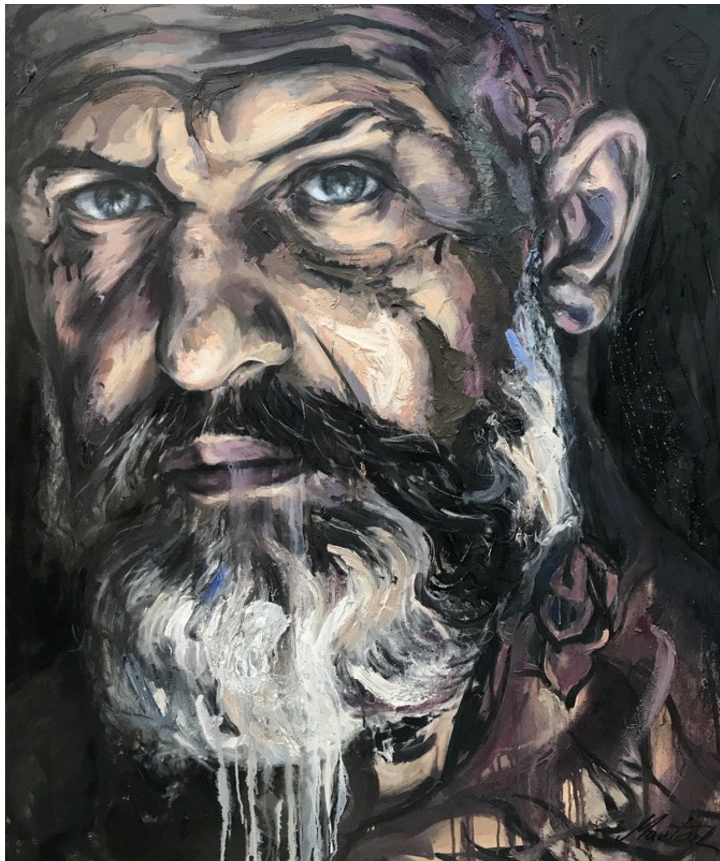
Paweł Reduch, olej na płótnie, 120 x 100, 2025