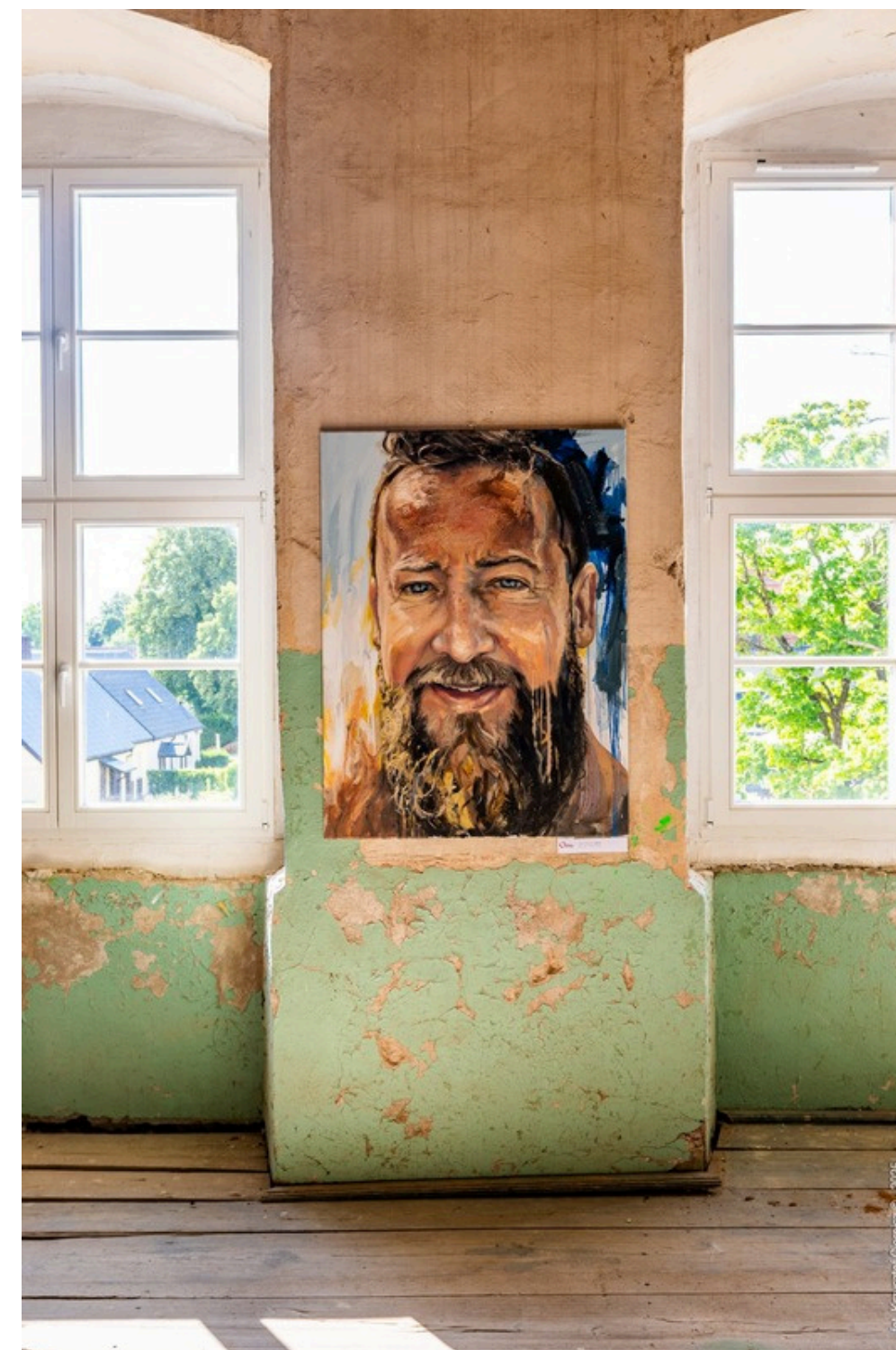
III Międzynarodowy Przegląd Sztuki Od Gór Po Morze