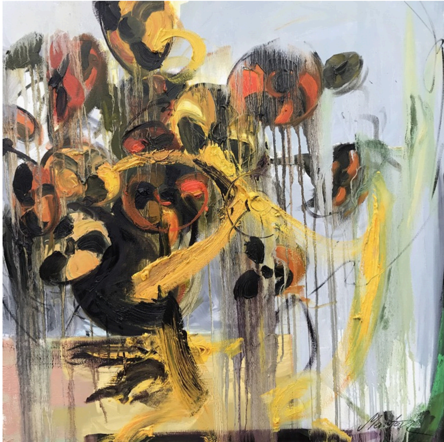
Radioaktywne słoneczniki, olej na płótnie, 100x100, 2023